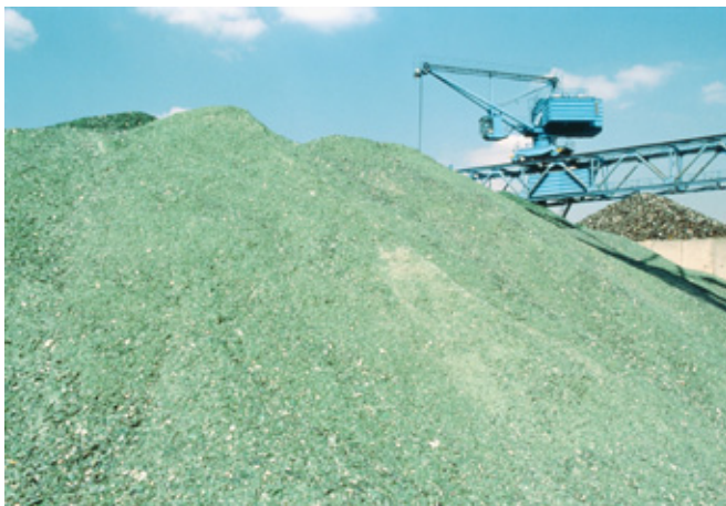
Sortierte Scherben als Rohmaterial für Glashütten

Flasche zu rund 60 Prozent aus Altglasscherben, Grünglas-Flaschen bestehen sogar bis zu 90 Prozent aus Altglasscherben. Die Verpackungsglasindustrie spart heute durch Glasrecycling etwa 20 Prozent der Schmelzenergie. Und nicht nur energetisch lohnt sich der Einsatz: Für die Herstellung von einer Tonne Rohglas werden 1,2 Tonnen Rohstoffe verbraucht – Recyclingglas kann diese fast komplett ersetzen. „Die Behälterglasindustrie hat ein großes Interesse, den Scherben Einsatz zu halten und auch weiter auszubauen“, erklärt Sheryl Webersberger vom Bundesverband Glasindustrie.