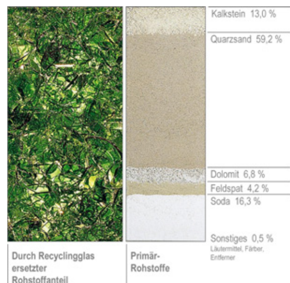
„Glas-Rohstoff“ / Foto: Sain-Gobain Oberland AG

Altglas hat damit heute in der Behälterglasindustrie in Deutschland den Quarzsand als ursprünglichen Hauptbestandteil ersetzt. Im Durchschnitt besteht mittlerweile jede